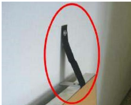
Modell "WT sec "

Sicherungs- und Aufhängegurte, damit sind Sie flexibel und können die Elemente in jeder Höhe punktgenau einsetzen. Wasserschäden an Wänden und sogar Decke sind somit schnell zu beseitigen.