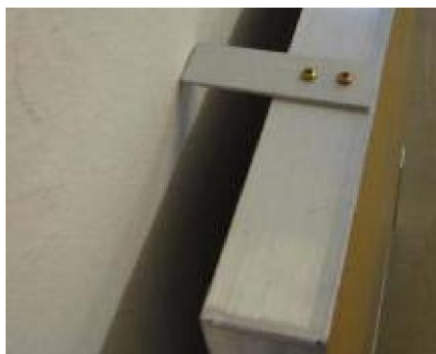
Bild 2 Abstandshalter zur Wand