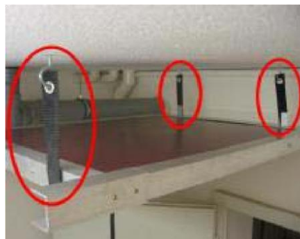
Modell "WT Maxi "

Mit dem Sicherungsgurt werden die Infrarot-Wandrockner gegen das Umfallen gesichert. (In öffentlichen Gebäuden besonders wichtig.)