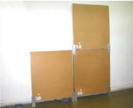
Bild 5 Flächentrocknung