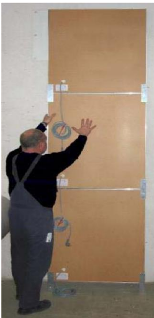
Bild 6 Flächentrocknung