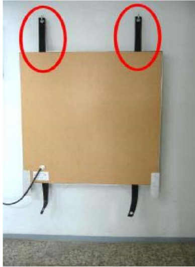
Modell "WT Profi "

An den Zweipunktgurten lassen sich die Infrarot-Wandrockner sicher an Wänden aufhängen (für den schwebenden Einsatz)