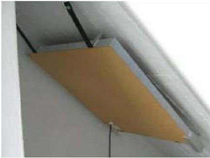
Bild 4 Montage an Dachschrägen